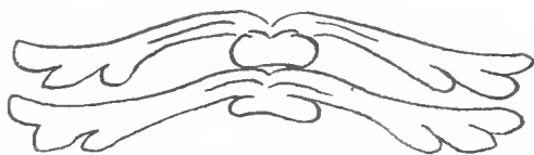
Fig. 5. — Granelia naivashae , n. g., n. sp., caecums trilobés.

fesseur Maurice GRANEL qui a occupé pendant de longues années la chaire d'Histoire naturelle médicale à la Faculté de Médecine de Montpellier.